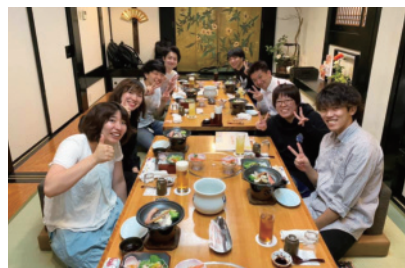
院の仲間と飲みニケーション！プライベートな話で盛り上がりよう！！