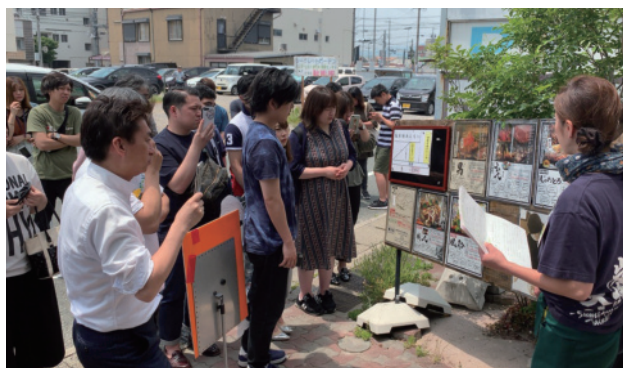
外食レストランや水族館などの異業種の成功事例から学ぶ見学ツアーや社内研修もあります。