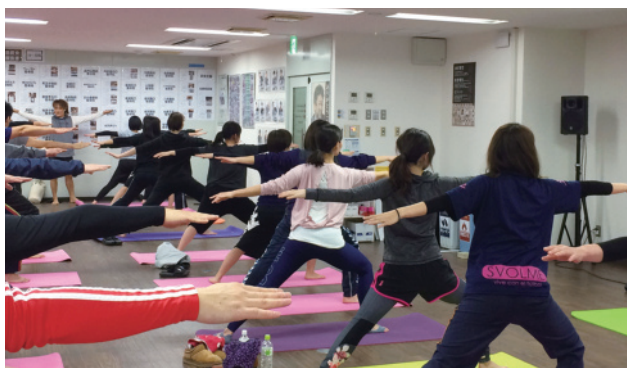
ヨガの体験スタジオ。普段は整骨院に勤務する女性柔道整復師がインストラクターとして活躍しています。

クラシオンでは、女性のスタッフが多数在籍しています。そんな女性の多くが関心を持つ「美容」。クラシオンは美容事業にも力を入れており、美容鍼・骨盤矯正・足のケアなどのメニューの他に、痩身機器のハイパーナイフによる施術を導入。院で働く美容に関心のある柔整・鍼灸の先生方が治療メニューと合わせて患者様に提供しています。また、社内イベントでは、ヨガ体験セミナー等も開催しており、様々な知識・スキルを習得することが出来ます。