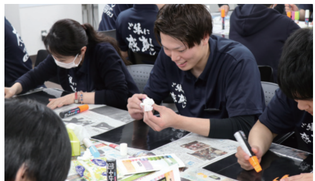
ブラックボード研修(POP研修)もあります。新卒研修でここまでやるのはクラシオンだけです！