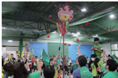
社内イベントの大運動会。全国の仲間が集まり色々な競技で競い合います。