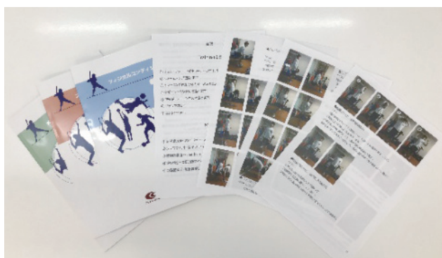
有名講師が監修したトレーナーマニュアルを使用しugに現場で活かせる技術・スキルを習得します。

クラシオンでは整骨院業務の他に、トレーナー活動にも力をいれています。バスケ・野球・レスリングetc、PROスポーツ～高校・大学の部活動まで、幅広く活動しており、トレーナーのレベルアップに向けた各種勉強会やセミナー等も多数開催しています。第一線で活躍する実績豊富なトレーナーの講師陣がクラシオントレーナーチームをサポートしており、基礎からしっかりと学んでいくことができます。また、学生アスリートへのトレーナー業務を強化すべく、高校や大学での活動を拡大していきます。そのために活動の土台となる基礎的なトレーニングメニューやケガのケア・リハビリなどをクラシオン独自にマニュアル化。対面による勉強会やクラシオン専用の動画サイトにて学んでいく事ができます。