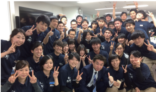
毎年多くの新卒が入社します。同期の数は日本一！