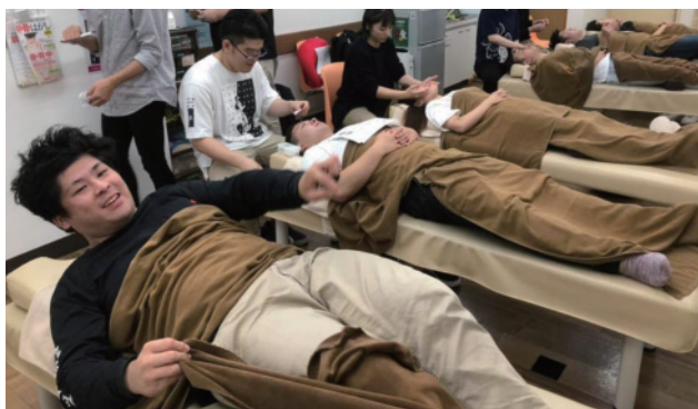
自由参加の社内勉強会(矯正・鍼・美容・手技療法、他)が充実しています。

新卒研修終了後も学びの場は多数用意しています。社内の各プロジェクト毎に定期開催される勉強会は自由参加。矯正・手技療法・美容鍼・経営など、たくさんの勉強会から自由を選択して参加するシステムです。例えば「技術にちょっと自信が持てないな」と思えば技術の勉強会へ、という具合に自分の課題や目標に合わせて参加できるのが魅力です。新卒研修終了後に同期の仲間と再会できるのも楽しみの一つです。また、外部講師を招いてのセミナーも多数開催。マネージメント・経営・接遇のセミナー・スポーツトレーナー・整形外科ドクターによる外傷研修など、技術だけでなく様々な知識を学ぶこともできるのがクラシオンの強み。治療家としてだけでなく、一人の人間としての魅力を高める学びがたくさんあります。