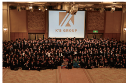
毎年12月は全員参加の社員総会。二部の大忘年会では恒例のビンゴ大会を開催！毎年豪華な景品が多数！