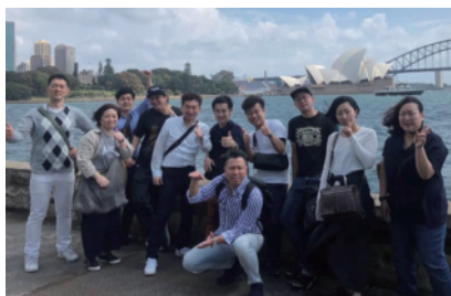
海外研修旅行を開催！これまでもシドニー・ラスベガス・シンガポールなど多くの国を回りました！

患者様・お客様の笑顔はもちろん、スタッフ、そのご家族まで笑顔で過ごせるよう、クラシオンは職場環境作りに力を入れて参ります。