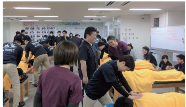
実技では基本の手技療法・矯正治療・筋膜ストレッチなどを勉強します。