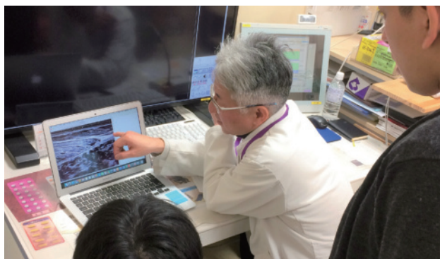
技術顧問の整形外科ドクターによる外傷研修。クリニックの中で画像診断などを学びます。