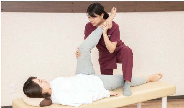
ケガの予防や可動域の向上に効果のあるストレッチ。筋肉を緩めることで関節への負担を軽減します。