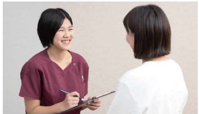
患者様の「心の串」を抜くために、笑顔になって頂くために、私たちは明るい笑顔を絶やしません。