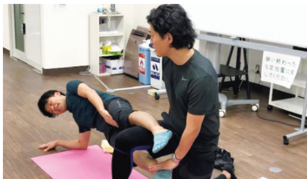
顧問トレーナーによる各種講座を随時開催しています。基礎から丁寧に教えて貰えるので、1年目の先生も安心して学べます。