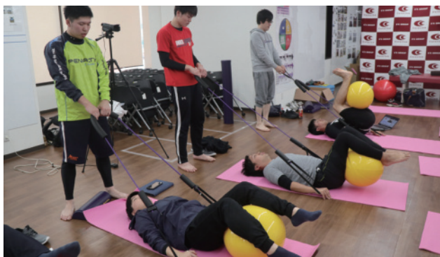
トレーナー活動が盛んなクラシオンでは、トレーニングメニューやコンディショニングの勉強会も盛んに行われています。