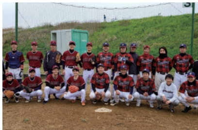
会社公認の部活動は現在、野球・バスケット・フットサルがあります。