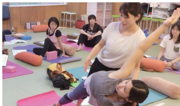
これまでスタッフから4名のグラヴィティヨガインストラクターが誕生しています。自分次第で活躍の場は多数！