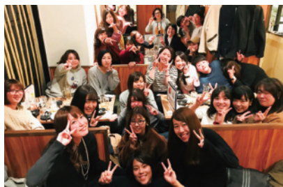
女子会を定期的で開催。クラシオンは女性スタッフの活躍を応援しています。