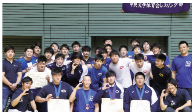
店舗近隣の大学・高校など、活躍の場がどんどん拡大していきます。大規模な大会や練習に参加し学生アスリートのケアを行います。