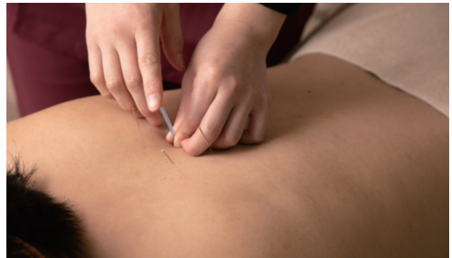
鍼治療の患者様も多く来院されます。局所治療の標治法と病の根源となる箇所アプローチする本治法を組み合わせ「全調整鍼」は痛みだけではなく予防にも効果的な治療です。