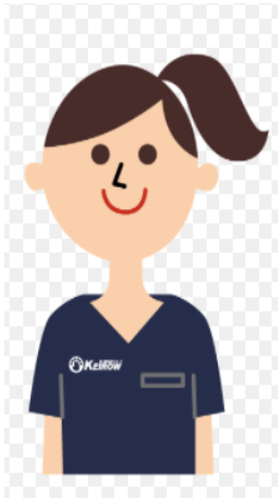
あん摩・鍼灸師 国際鍼灸専門学校 卒業