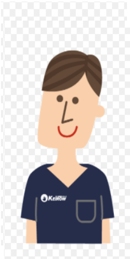
あん摩・鍼灸師 東京医療福祉専門学校 卒業

将来、独立を考えている方にも魅力的な職場だと思います。また、残業がないので家事・育児との両立もできる環境なので主婦（主夫）の方も両立して勤務しやすいです。