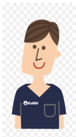
あん摩・鍼灸師 神奈川衛生学園 卒業