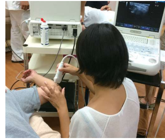
スポーツクターによるエコー講習会