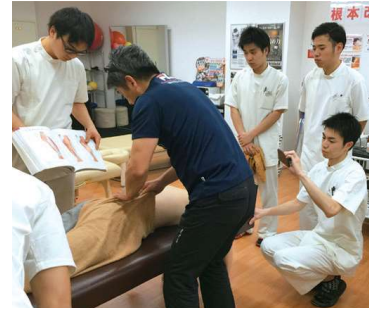
社長直伝のマッサージ研修