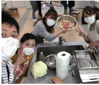
チーム対抗・料理対決