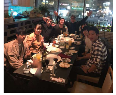
入社内定者による食事会