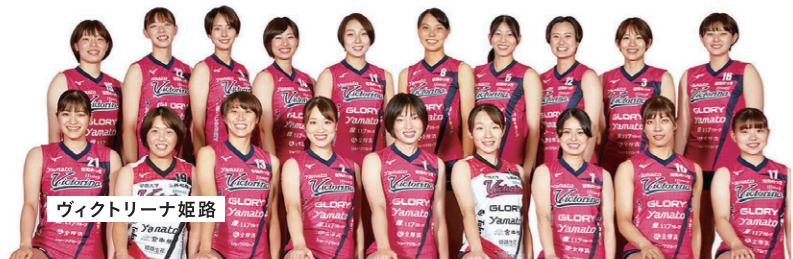
ヴィクトリーナ姫路

株式会社Rieden様には、チームに専属トレーナーを派遣して頂いております。選手 のコンディションを把握し、一人ひとりとしっかり向き合いながらケアを進めて くださるので、選手たちにとってはトレーナーとのコミュニケーションがメンタルケアにも繋がっています。また痛みや不調に 対するケアだけではなく、ケガをしにくい身体作りや選手それぞれ の弱点を強化するトレーニングメニューも作成して頂いて おり、チームに欠かせないとても頼もしい存在です。