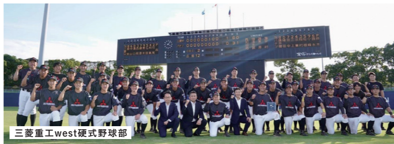
三菱重工west硬式野球部