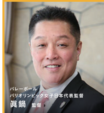
バレーボール パリオリンピック女子日本代表監督 眞鍋 監督